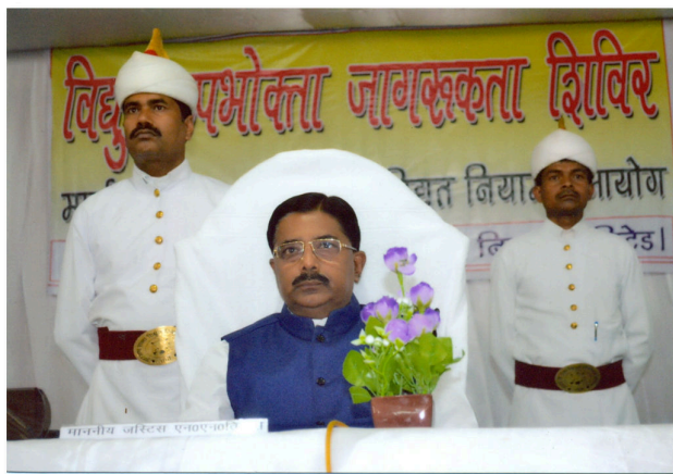
Consumer Awareness Programme held in 2016-17

The Commission continued the State wide campaign of Consumer Awareness which was started in the previous year. The JBVNL arranged programmes at different places under the aegis of the Commission. The programme received huge response from the Consumers and Hon'ble Chairman and Member of the Commission also addressed the attending public to make them aware of their rights and duties, electricity conservation and power saving etc.