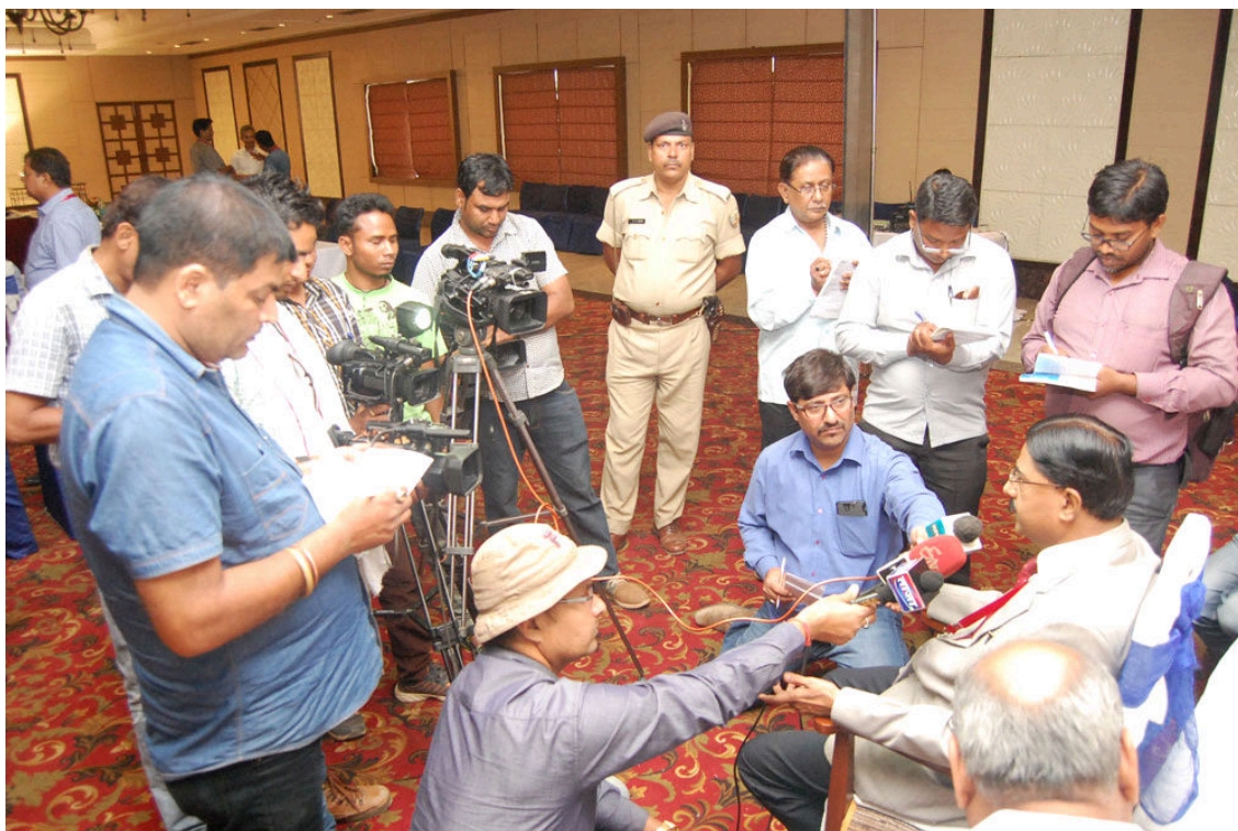
Hon'ble Chairperson briefing the Media