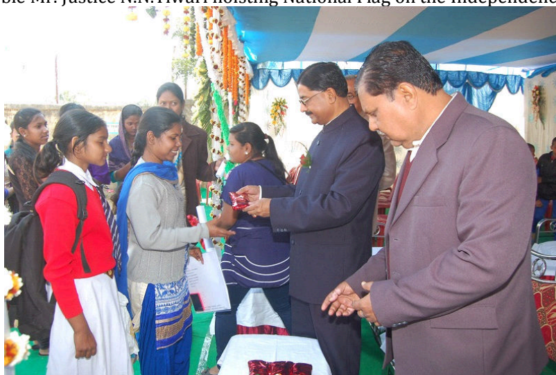
Hon'ble Mr. Justice N.N.Tiwari distributing prizes to participants on eve of Republic Day 2016.