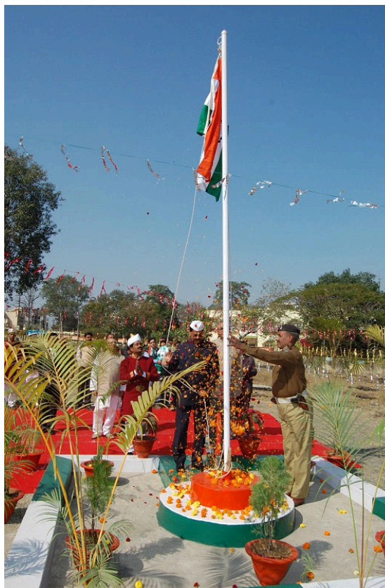
Hon'ble Mr. Justice N.N.Tiwari hoisting National Flag on the Independence Day.

Chairperson Hoisted the National Flag on 26 th January 2016 in the proposed building premises of JSERC.