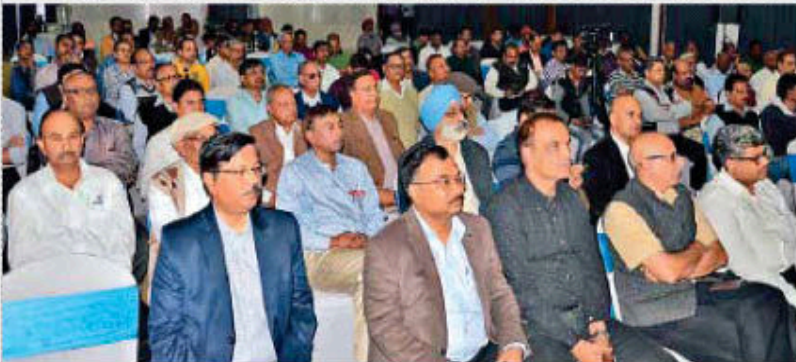
गोलमुरी ट्यूब मेकर्स क्लब में जन सुनवाई के दौरान उपस्थित लोग।