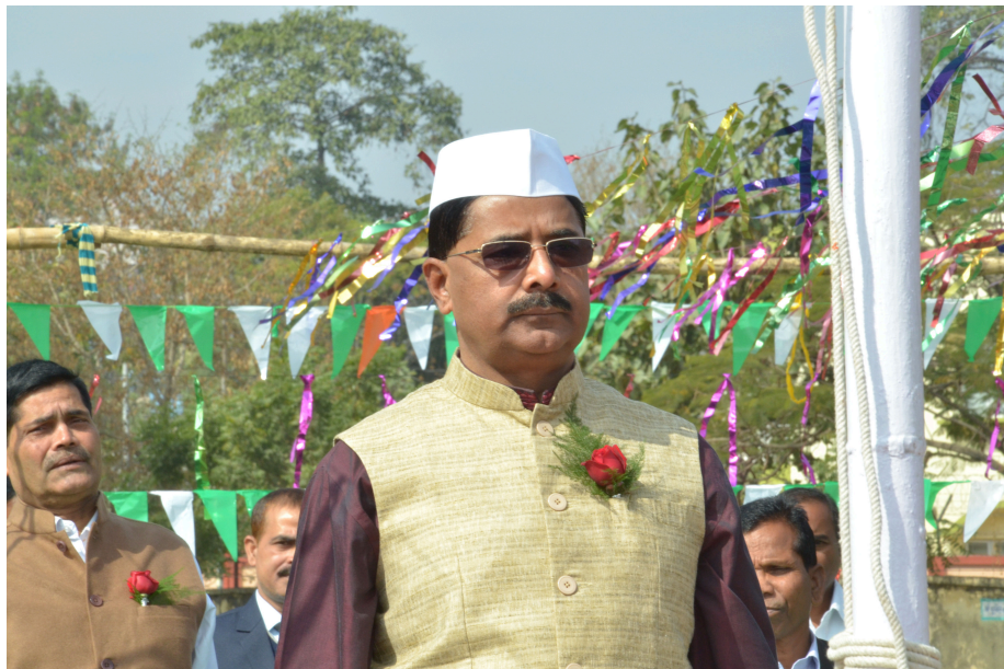
Hon'ble Chairperson Hoisting the National Flag