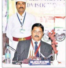
बैठक में उपस्थित न्यायमूर्ति एनएन तिवारी व अन्य.

उन्होंने उम्मीद जतायी कि सलाहकार समिति बिजली उपभोक्ताओं को उनके अधिकारों से